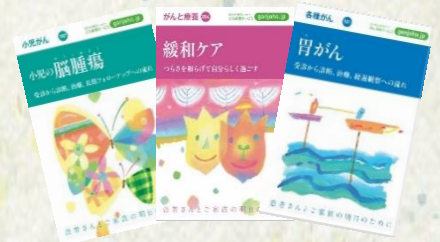
がんの冊子 国立がん研究センター発行