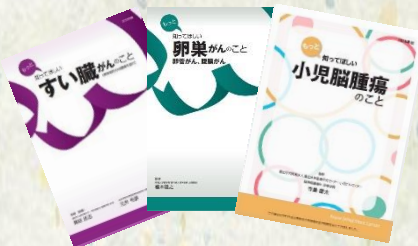
がんの冊子 がんネットジャパン発行