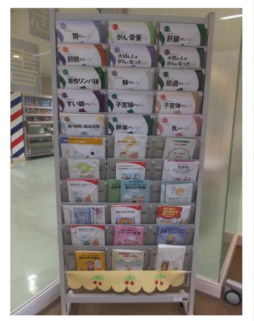
がんの冊子ラック