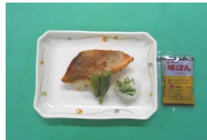
赤魚のおろしポン酢