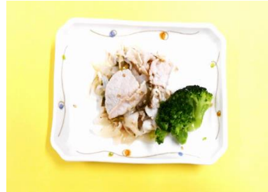
豚肉のねぎ塩焼き