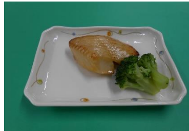
かれいのレモン風味焼