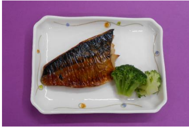
さばの漬焼き(学齢児食はかれのムニエル)