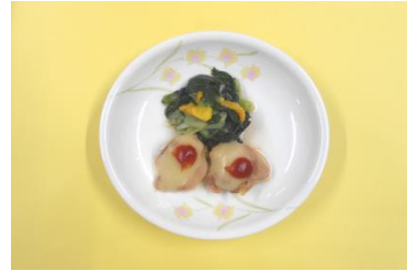
鶏肉のチーズ焼き