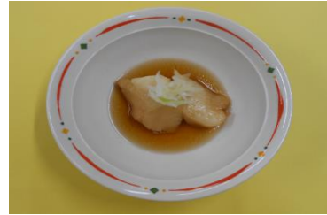
カレーの中華風煮