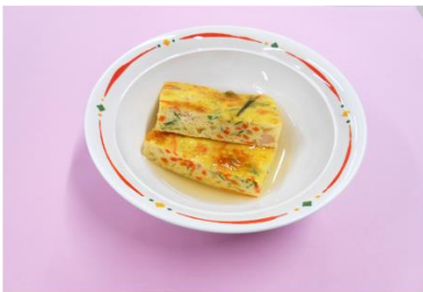
オムレツの和風あんかけ