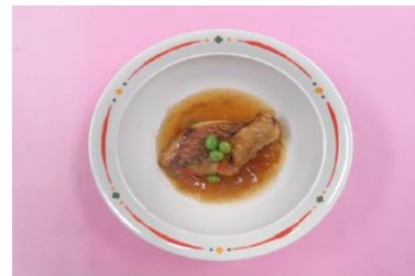
赤魚の甘酢あんかけ