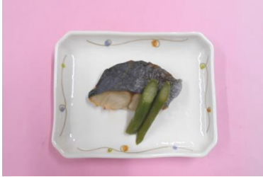
旬の魚の塩焼き(鯖)