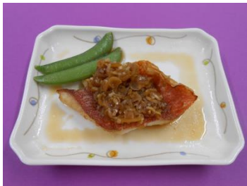
赤魚のねぎ甘酢ダレ