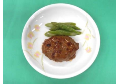
照り焼きハンバーグ