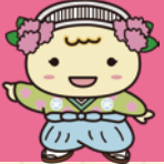
都島区社会福祉協議会 マスコットキャラクター「みやこりん」