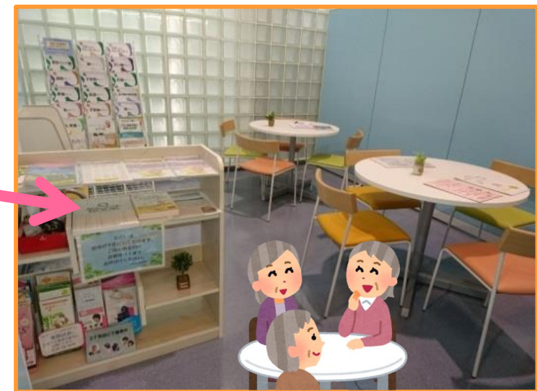
1階 がん相談支援センター