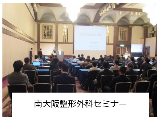
南大阪整形外科セミナー