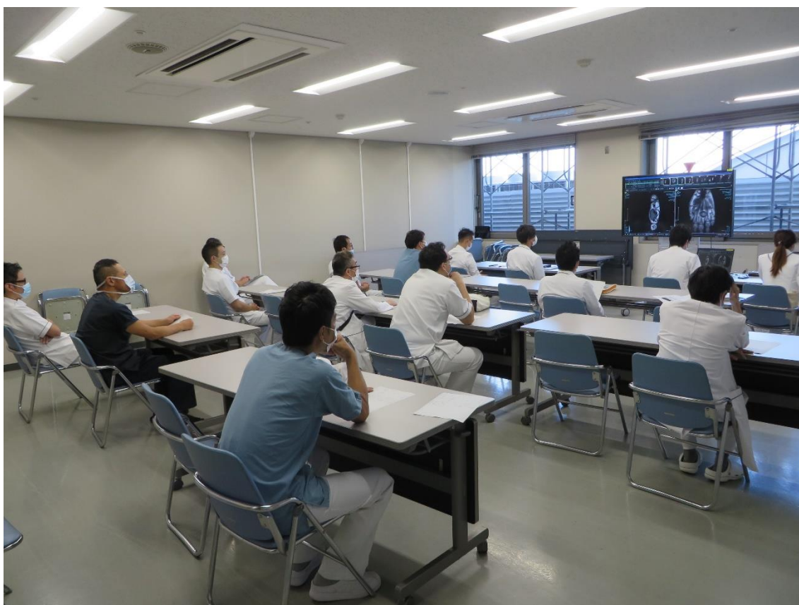
症例カンファレンス

チーム医療の必要性を理解しチームのリーダーとして活動できること、的確なコンサルテーションができること、他のメディカルスタッフと協調して診療にあたることが求められます。本専門研修プログラムでは、指導医と共に個々の症例に対して、他のメディカルスタッフと議論・協調しながら、診断や治療の計画を立てて診療していく中でチーム医療の一員として参加し学ぶことができます。また、毎日行われる術前・術後カンファレンスでは、指導医と共にチーム医療の一員として、症例の提示や問題点等を議論していきます。