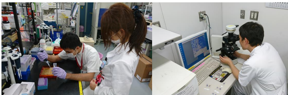
大阪公立大学大学院生による基礎研究の風景

本専門研修プログラムでは、基幹施設及び連携施設全体において脊椎外科、関節外科、スポーツ、手外科、肩関節外科、リウマチ、四肢外傷、骨軟部腫瘍、小児整形などの専門性の高い診療を早くから経験することができます。専門研修プログラム修了後の進路としては、大きく分けて大学院へ進学するコースと、直接サブスペシャリティ領域の研修に進むコースがあります。基幹施設である大阪市立総合医療センターにおいて専門性の高い診療を経験し、整形外科専門医取得後のサブスペシャリティ領域の研修へと継続していくことができます。また、大学病院と連携することにより大学院進学に備えた臨床研究及び基礎研究への関わりを持つことができます。