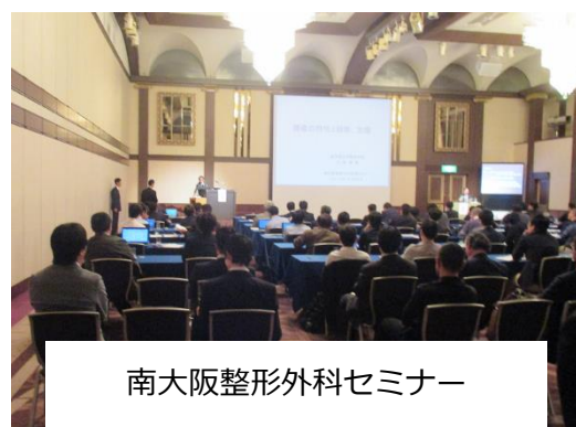
南大阪整形外科セミナー

また、大阪公立大学医学部附属病院整形外科主催の南大阪整形外科セミナーへの参加(年3回、下写真)、京阪神地区集談会もしくは中部整形災害外科学会での研究発表(研修期間中に2回以上)を行うことにより、臨床研究に対する考え方を習得することができ、また学会発表に対する訓練を積むことができます。