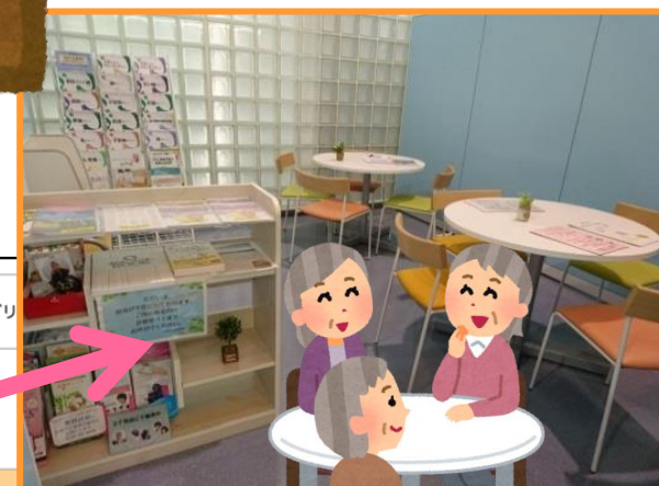
1階 がん相談支援センター