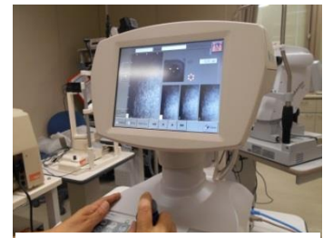
<角膜内皮細胞撮影>