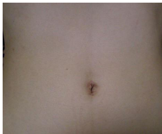
単孔式腹腔鏡下手術の創